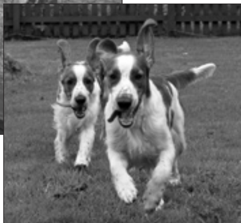
Redspots Picnic in the Park röjer med sin kullbror Redspots Only the Brave. Ägare är Åsa Moe.