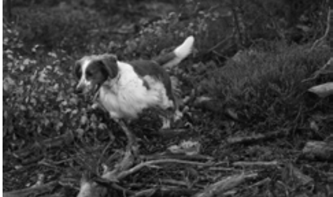
Zelda