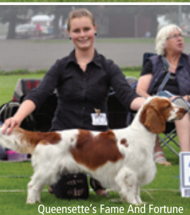
Queensette's Fame And Fortune