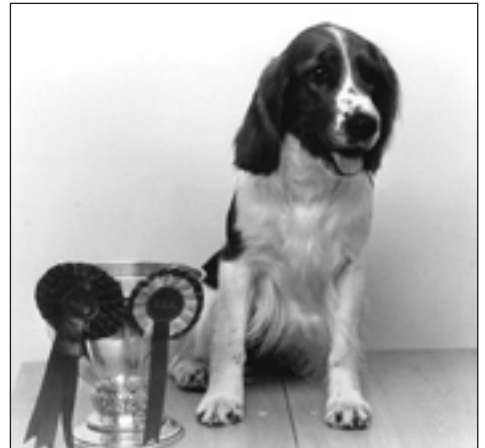
Club Show-vinnare 1982

På klubbmötet rekommenderades medlemmarna att HD-röntga sina hundar.