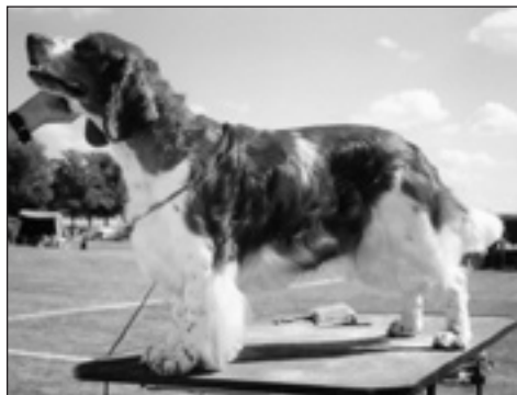
Don's Serious Moonlight

Klubbmästerskapet i Jakt och viltspår hölls i Dimbo/Hökensås utanför Tidaholm., i jaktklassen startade 5 hundar och i prova-på-klassen var det 4