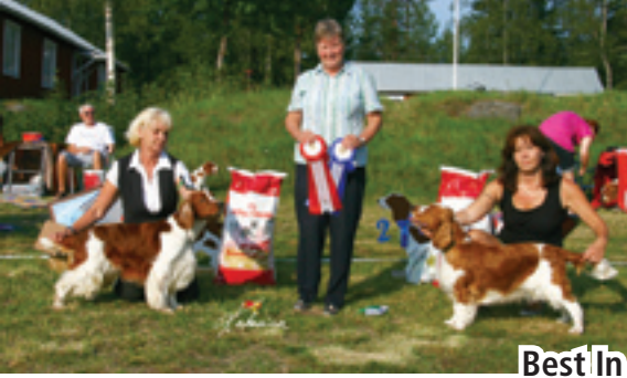
Best In Show