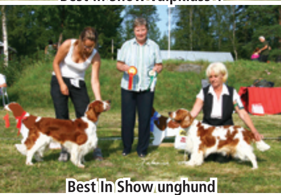
Best In Show unghund