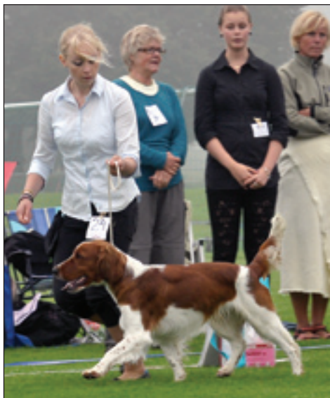
Hallonbos Björksopp.