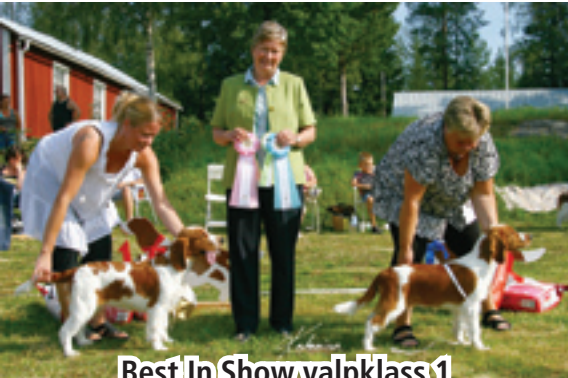
Best In Show valpklass 1