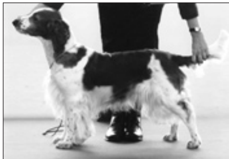
Begin The Begin Welsh Of Salt And Pepper

Club-Show 2006 var i Simlångsdalen vid Halmstad