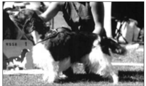
Club Show-vinnare 1997

Årets Club-Show hölls vid Nääs Slott i Göteborg där närmare 170 hundar deltog..