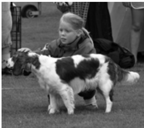
Blivande proffs....

e Wainfelin Countryman u SE U(u)Ch Trigger Fly Uppf C Hultgren, Landskrona Ågare C. Arvidsson Kumla