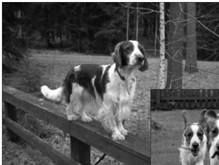
Redspots Paradis-Oskar övar balansen under en promenad. Ägare är Åsa Moe.