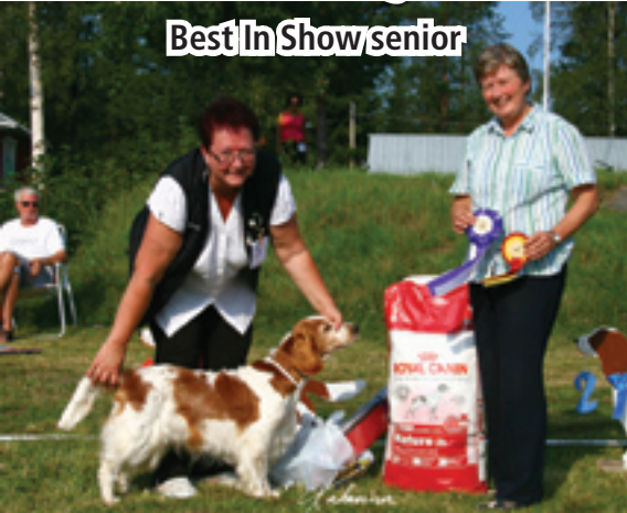
Best In Show senior