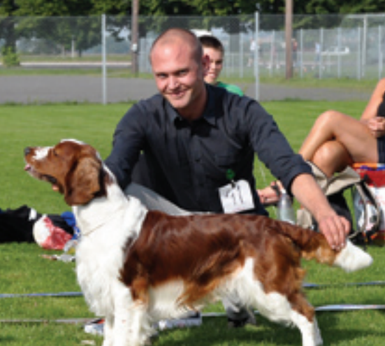
Dimmös Jumping Bacon