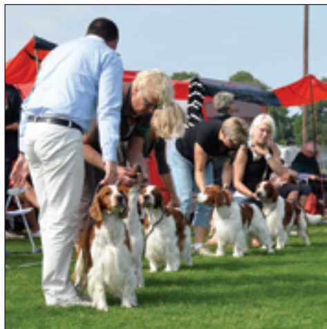
Championklass hanar.