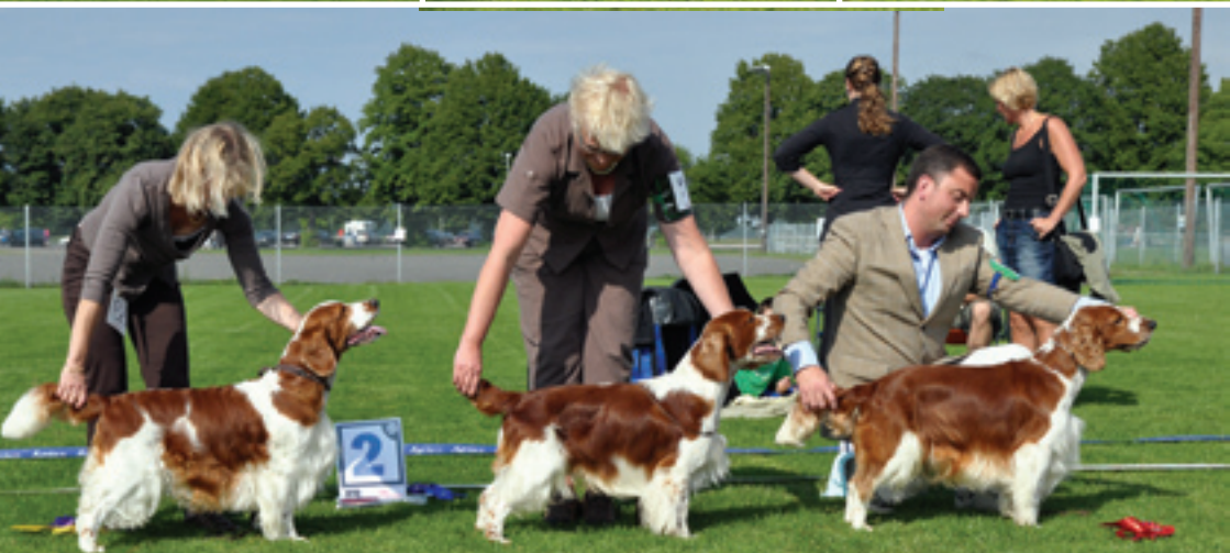
Ch Dons Trubadur, Ch Clussexx Pay Per view, Ch Don's Postman