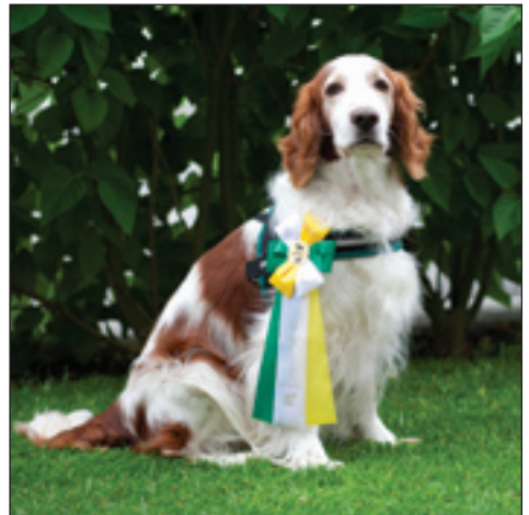
SE VCh SE(u)Ch Lp 1 Freckles Speedy Gonzales Äg: Bengt & Gunilla Alsterfjord, Helsingborg