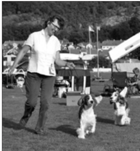
BIM-tiken fick sällskap i ringen....