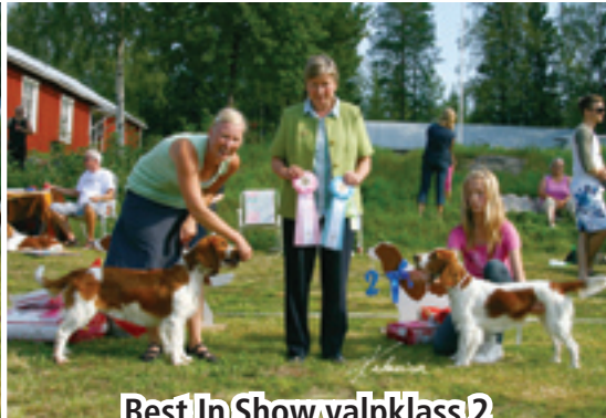
Best In Show valpklass 2