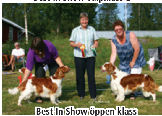
Best In Show öppen klass