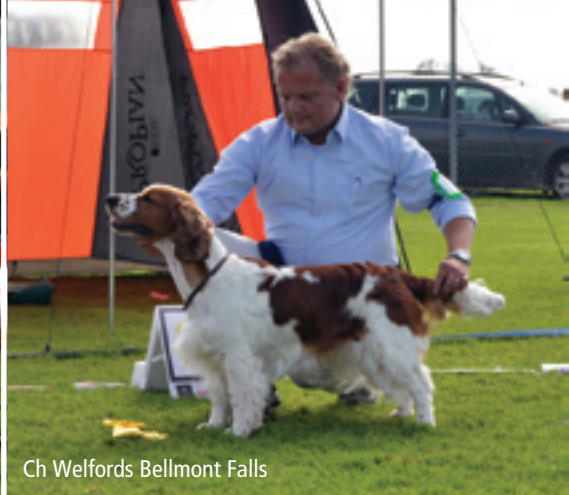
Ch Welfords Bellmont Falls